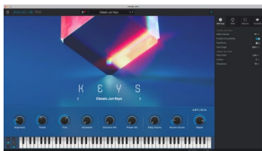
Analog Lab Pro