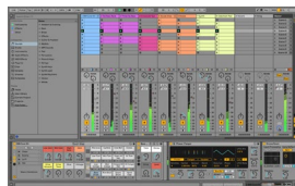
Ableton Live Lite