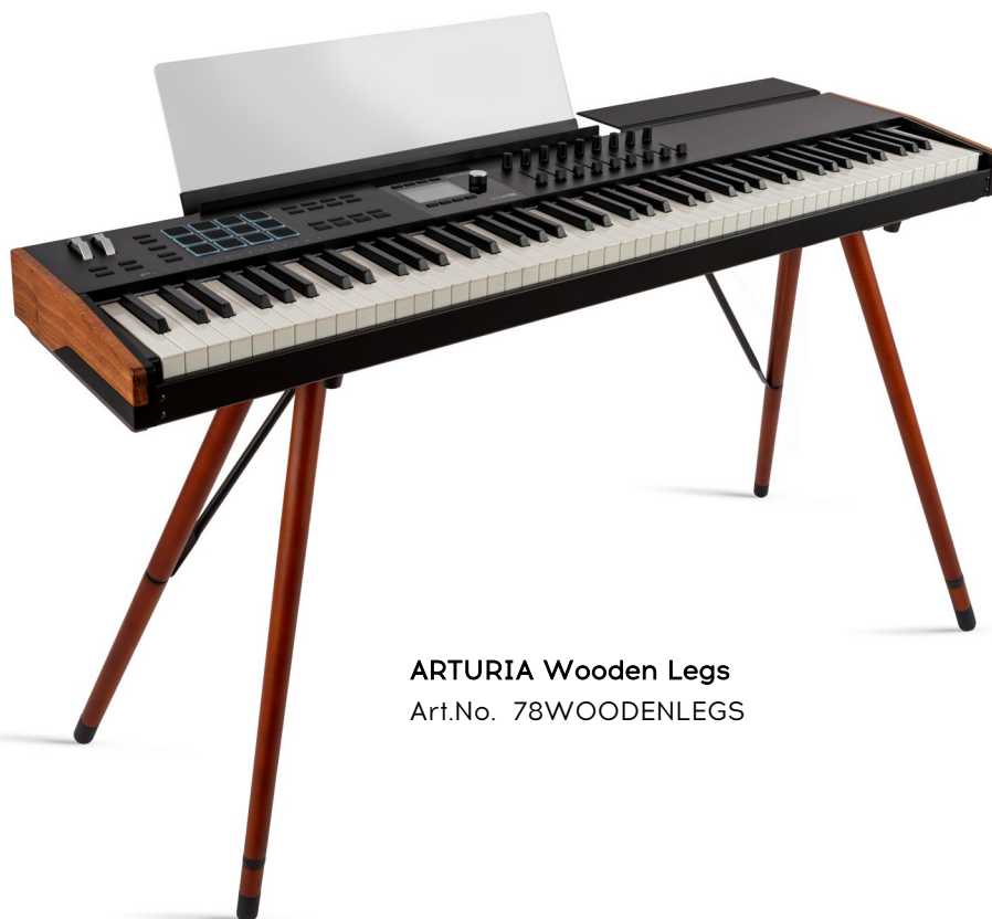
ARTURIA Wooden Legs Art.No. 78WOODENLEGS

Optional: Wooden Legs - stylischer Keyboardständer mit Holzbeinen