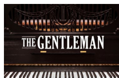
NI The Gentleman