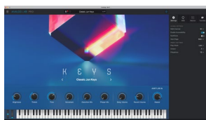
Analog Lab Pro